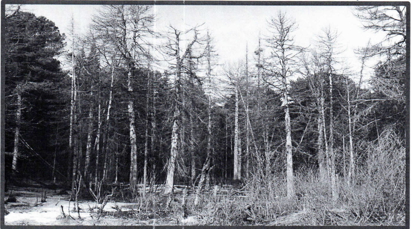
Изображение № 4 Сухостойное дерево. Не является валежником Изображение № 5

Кроме того, необходимо обратить внимание, что деревья, которые лежат на земле, но не имеют признаков естественного отмирания (имеют зеленую листву или хвою), определять как «мертвые» не допускается (смотри изображение № 5).