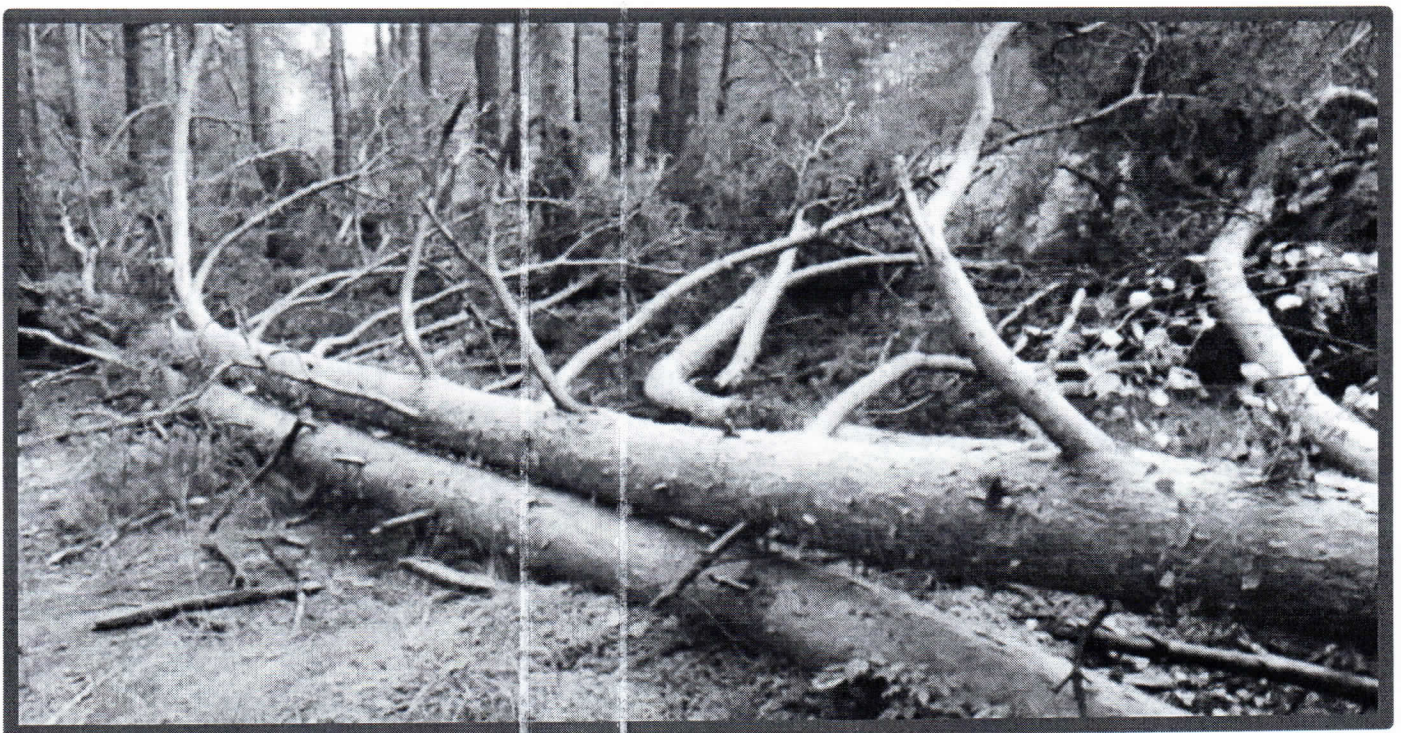
Лежащее на поверхности земли ветровальное дерево, не имеющее признаков отмирания. Не является валежником

Кроме того, необходимо обратить внимание, что деревья, которые лежат на земле, но не имеют признаков естественного отмирания (имеют зеленую листву или хвою), определять как «мертвые» не допускается (смотри изображение № 5).