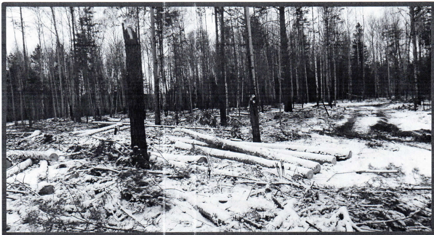
Изображение № 7 Брошенная древесина вдоль лесовозных дорог. Не является валежником